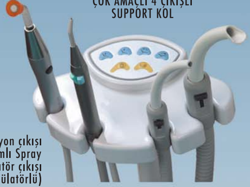
ÇOK AMAÇLI 4 ÇIKIŞLI SUPPORT KÖL