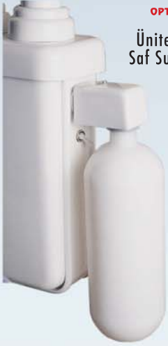
Ünite Monte Saf Su Deposu