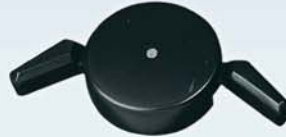
Ayaktan Koltuk Kumandası