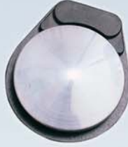
Hız ayarlı Pnömatik Sistem Pedal