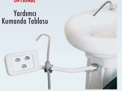
Yardımcı Kumanda Tablosu