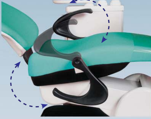
Hareketli Sağ Kol